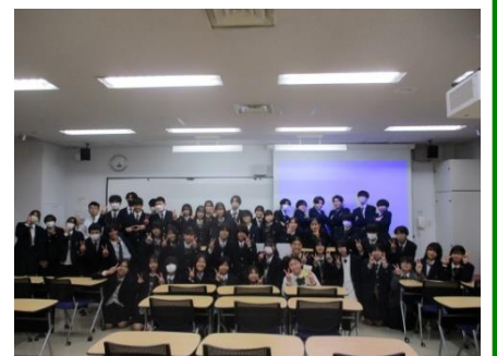
本校から参加した1、2年生